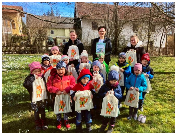
Igel- und Raupenvorschulkinder

Wir wünschen den Vorschulkindern schon jetzt einen guten Start ins Schulleben und viel Freude beim Lesen, Schreiben und Rechnen lernen!