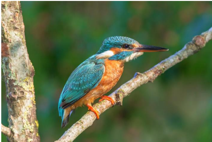
Schillernde Farbenpracht des Eisvogels

um dort bis zu 80 cm tiefe Bruthöhlen mit ihren Schnäbeln hinein zu hacken. In der Höhle werden die Eier und später die Jungvögel abwechselnd vom Weibchen und Männchen bebrütet. Nach der Brut bleiben die Altvögel ihrem Revier treu und sind im Isental ganzjährig zu beobachten. Die Jungvögel hingegen gehen auf Suche nach einem eigenen Revier. Hier begeben sie sich auf eine Wanderung mit einer Entfernung bis zu 1000 km. Die Elterntiere bleiben im Revier zurück und starten häufig eine zweite Brut. Der bayernweit gefährdete Eisvogel ist mit seinem auffälligen Federkleid wahrscheinlich einer der schillerndsten Schätze des Isentals.