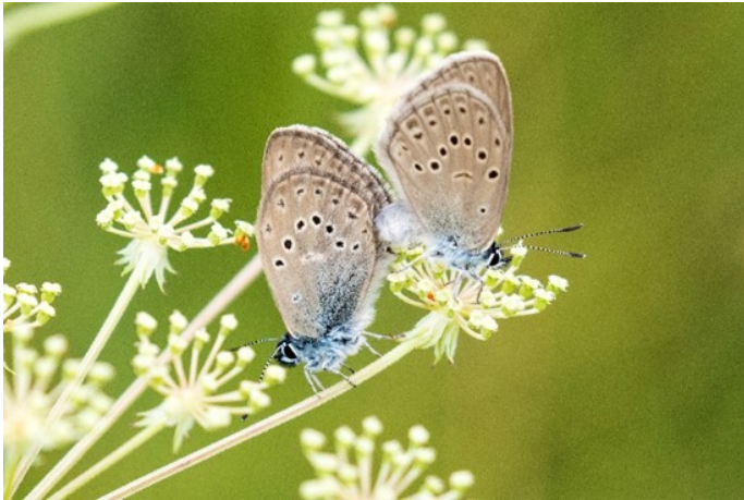
Paarung im Sommer

finden. Dabei ist seine Entwicklung ein kleines Wunder der Natur: Im Sommer werden die Eier in die Blüte des Großen Wiesenknopf gelegt. Sind die Raupen geschlüpft, fressen sie dort, bis sie im Herbst auf den Boden fallen. Hier werden sie aufgrund ihres Dufts und ihrer Honigdrüsen von Knotenameisen aufgesammelt und ins Ameisennest getragen, wo sie räuberisch von der Ameisenbrut leben. Verborgen im Ameisennest findet jetzt im Winter die Verpuppung statt. Ist der Tagfalter im Frühjahr erst mal aus dem Kokon geschlüpft, muss er schnell raus aus dem Nest, da er seinen Duft und somit seine Tarnung verliert. Den kleinen, weißbläulich schimmernden Wiesenknopf-Ameisenbläuling findet man im Isental noch auf extensiven Feuchtwiesen im Thalhamer Moos. Angewiesen auf diesen speziellen Lebensraum und seine Raupenfutterpflanze, den Großen Wiesenknopf, ist er ein ganz besonderer Schatz des Isentals.