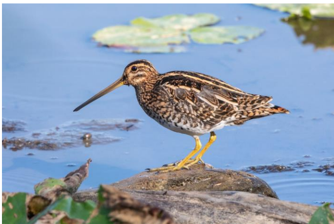
Selten zu sehen – die Bekassine

Neben der Wiederherstellung von Lebensraum können wir diesen seltenen Bewohner durch Ruhe während der Brut unterstützen. Bitte meiden Sie daher die Wiesenbrütergebiete im Isental und besuchen diese bis Mitte Juli weniger. Jeder Einzelne kann somit einen Beitrag zum Erhalt der Art leisten.