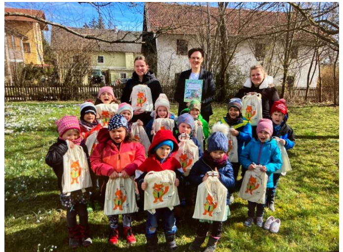
Igel- und Raupenvorschulkinder

Wir wünschen den Vorschulkindern schon jetzt einen guten Start ins Schulleben und viel Freude beim Lesen, Schreiben und Rechnen lernen!