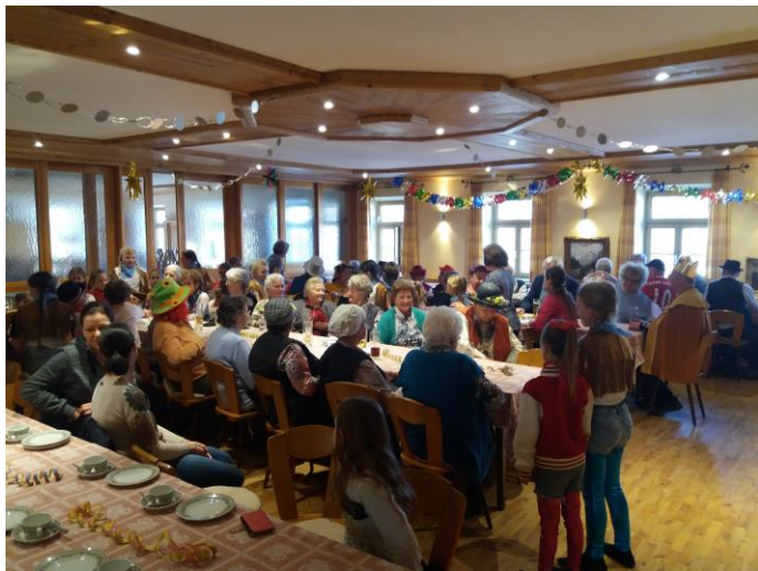
Amüsanter Seniorenfasching im Gasthaus Menzinger