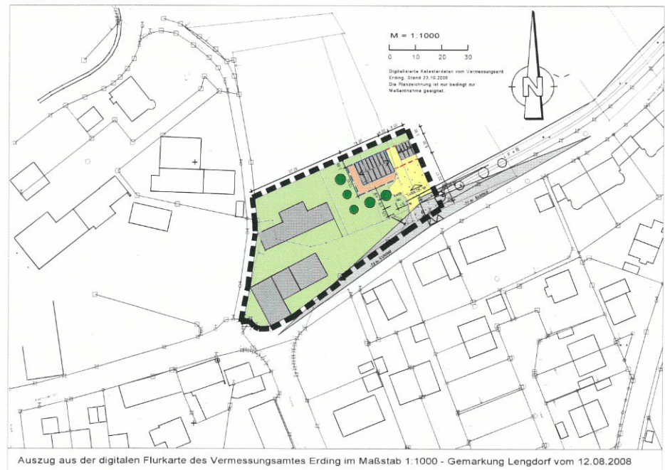
Auszug aus der digitalen Flurkarte des Vermessungsamtes Erding im Maßstab 1:1000 - Gemarkung Lengdorf vom 12.08.2008