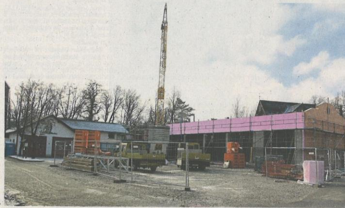
Ein großes Projekt im Ortskern ist der Neubau des Feuerwehrhauses.

Für das Zentrum der Gemeinde hat die Ortschaft noch viele Wünsche offen.